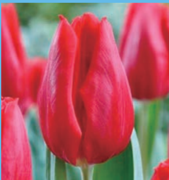
ファーストスター First Star