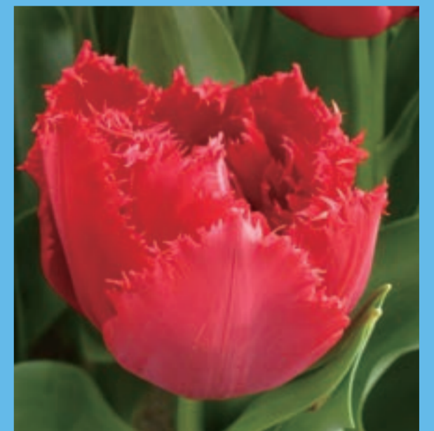
ライオンキング Lion King