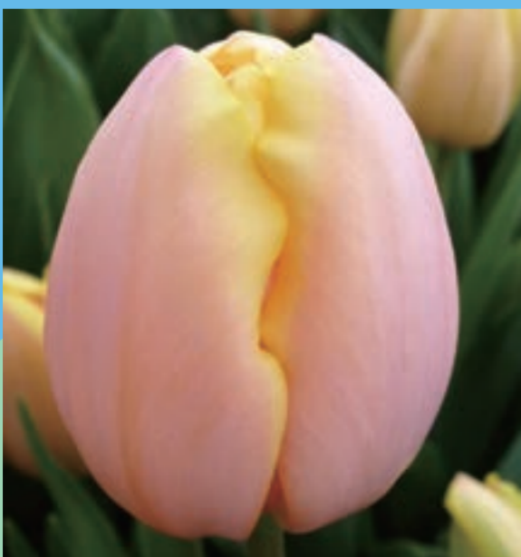
マンゴーチャーム Mango Charm