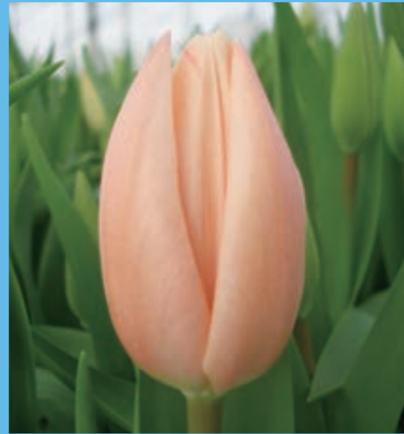
タイスブーツ Thijs Boots