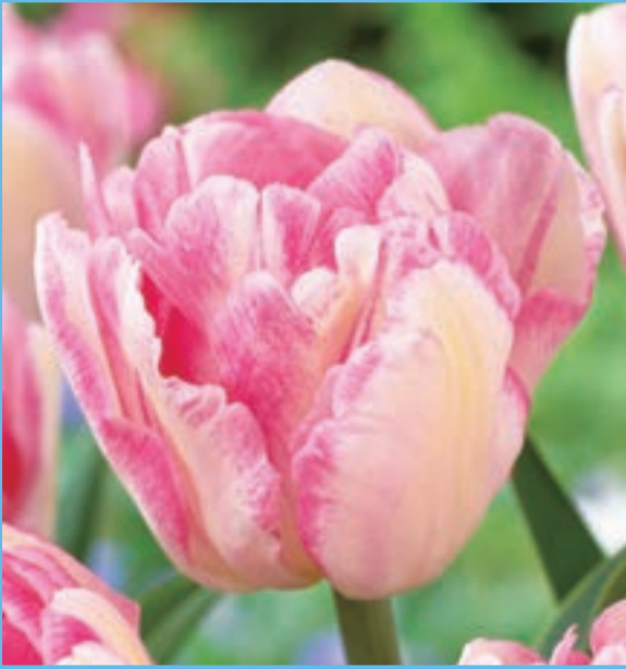
フォックストロット Foxtrot