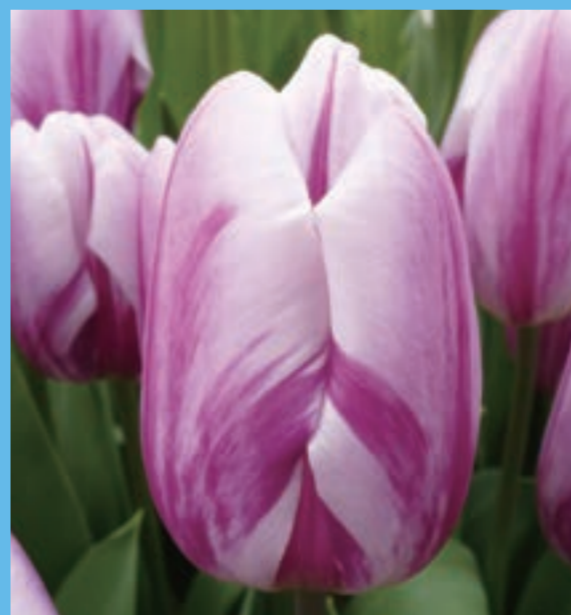
ストライプドフラッグ Striped Flag